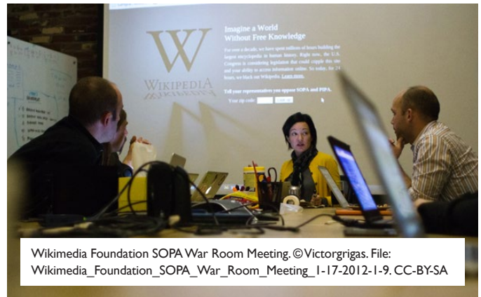
Wikimedia Foundation SOPA War Room Meeting.

Simpel! Ga naar een Wikipedia pagina en klik op bewerken. Voeg informatie toe aan een bestaand artikel, corrigeer een fout, verbeter de taal of schrijf een nieuw artikel over een onderwerp dat nog niet in Wikipedia staat. Wikipedia is zo ontwikkeld dat iedereen een artikel kan bewerken of schrijven. Er is een handleiding en er zijn online cursussen, uitgebreide hulpfuncties en oefenpagina's. Daarnaast zijn er ervaren Wikipedianen die je graag met raad en daad bijstaan. Om communicatie met andere bewerkers makkelijker te maken kun je een account aanmaken met een zelfgekozen gebruikersnaam. Meer weten? Ga naar Wikimedia Commons en download de meest recente versie van de ' Handleiding Wikipedia '.